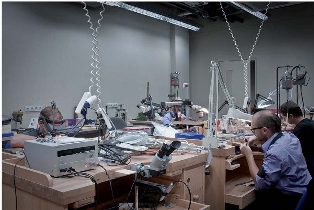
Zlatnická dílna v naší reprezen- tativní prodejně